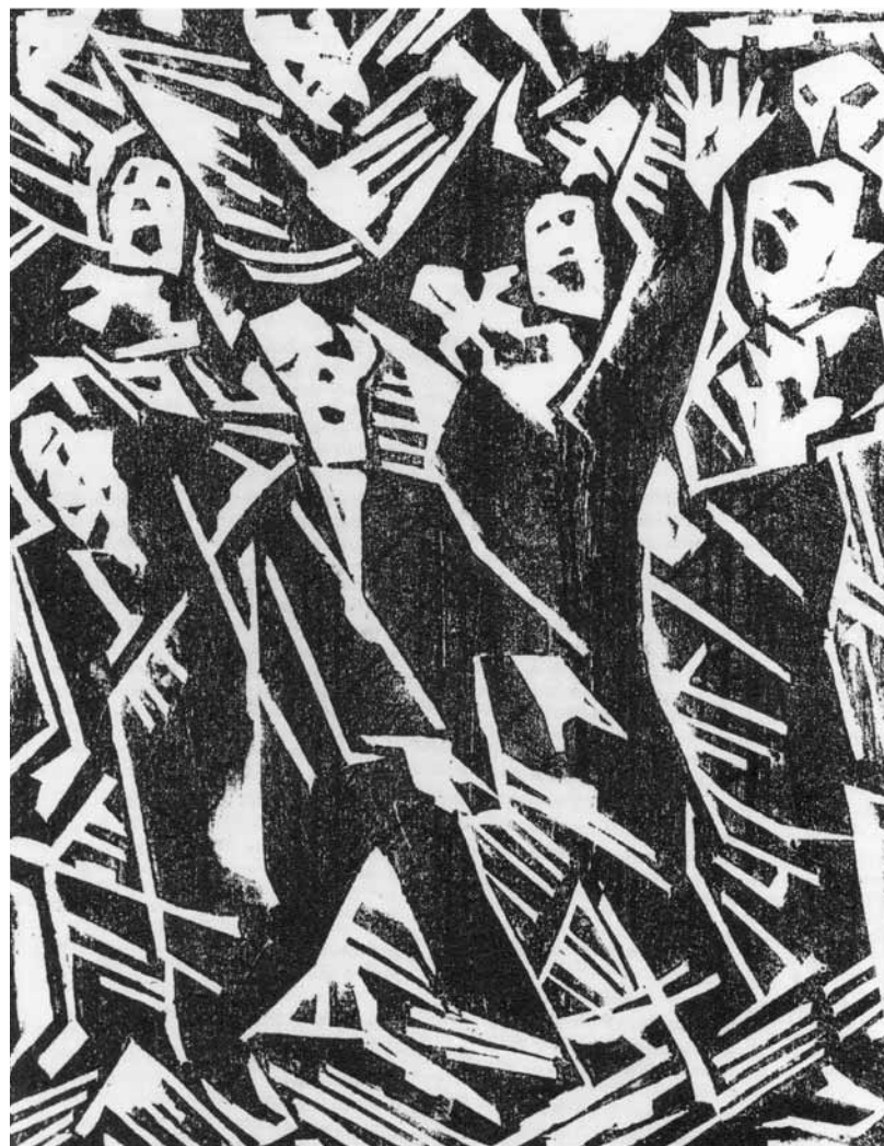
Fritz Schaeffler, Ausrufen der Freiheit, 1918